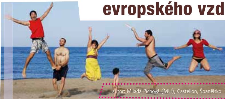
autor: Milada Píchová (MU), Castellon, Španělsko

Stranou rozhodně nezůstávají ani čeští účastníci, o jejichž zahraniční pobyty v rámci programu se v posledních letech stará Národní agentura pro evropské vzdělávací programy (NAEP). V České republice program Erasmus funguje od roku 1998. Od té doby již vyjelo do zahraničí na zkušenou přes 40 000 účastníků. V posledních letech se počet českých studentů, ať už využívajících možností studijního pobytu nebo pracovní stáže, pohybuje kolem 5 000 ročně. V čele tabulky navštívených zemí je už od počátku Německo, následované Francií, Španělskem a Velkou Británií.