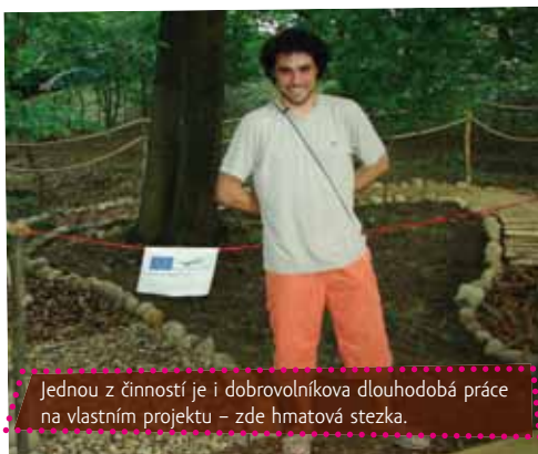
Jednou z činností je i dobrovolníková dlouhodobá práce na vlastním projektu – zde hmatová stezka.

Zásadní pro průběh projektu je komunikace s potenciálními dobrovolníky a kritéria pro jejich výběr. Dnes už nehodnotíme tolik vzdělání a praxi v životopisu, ale koukáme hlavně na to, jaká je motivace dobrovolníka pro účast na našem konkrétním projektu.