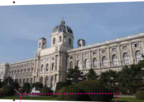
Uměleckohistorické muzeum ve Vídni

Příští rok oslaví dvacáté výročí založení česko-rakouský program Aktion, který už od roku 1992 přispívá k rozvoji dvojstranné spolupráce ve vědě a vzdělávání. Společný projekt ministerstev školství obou zemí umožňuje každoročně několika stovkám českých a rakouských studentů i pedagogů studovat či působit v partnerské zemi a podporuje tak vzájemné porozumění. Aktion se soustředí především na podporu menších projektů, do kterých je zapojena i mladší vědecká generace a jež mají naději na pokračování.