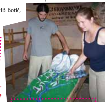
Další ukázka dlouhodobého projektu – model vodního toku