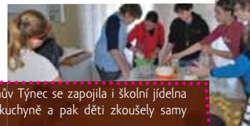
Do projektu ZŠ Hrochův Týnec se zapojila i školní jídelna třemi dny slovenské kuchyně a pak děti zkoušely samy některá jídla uvařit.