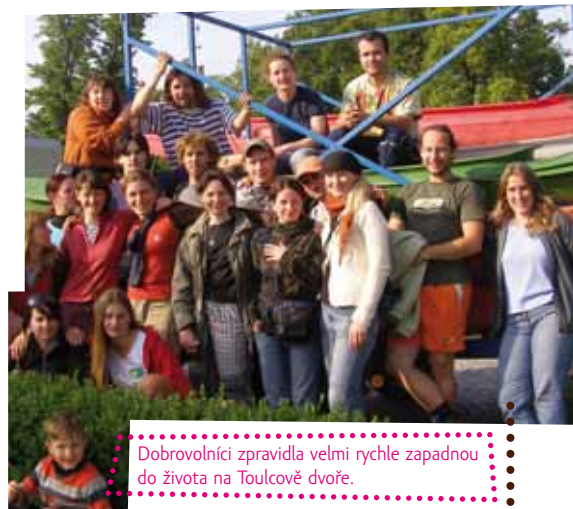
Dobrovolníci zpravidla velmi rychle zapadnou do života na Toulcově dvoře.