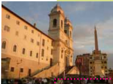
autor: Vojtěch Pošmourný (ČVUT), Řím, Itálie

(Referentka oddělení mobilitních programů, Technical University of Denmark v Lyngby)