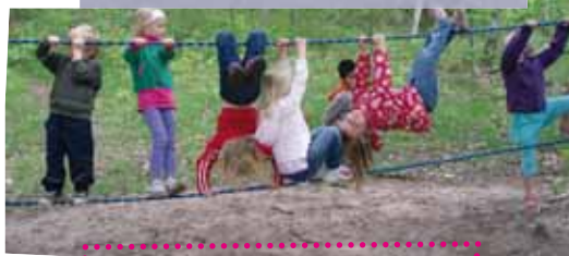
Dovádění na zahradě mateřské školky

V oddělení jsou děti od jednoho roku do šesti let, na dvě desítky předškoláků připadají dvě učitelky a navíc ještě asistentka. „Švédové velice citlivě rozvíjejí osobnosti dětí, všechny činnosti probíhají