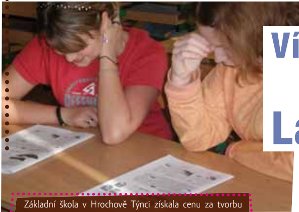
Základní škola v Hrochově Týnci získala cenu za tvorbu mezinárodního školního časopisu.