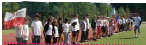
Žáci 18. základní školy v Mostě se zdokonalovali v cizích jazycích prostřednictvím tradičních míčových her zemí Visegrádské čtyřky.

„Vzhledem k současné situaci v Evropě jsme zvolili téma migrace. Všechny země vstoupily do projektu s určitým typem ‚exilu‘, který chtěly vysvětlit ostatním. Turci přiblížili migraci svých krajanů do Německa, partneři z Rumunska vysvětlovali jeho složitě postavení v rámci EU a častou migraci za prací do jižní Evropy. Italové představili svou vlast jako zemi, která musí ze zákona poskytnout azyl uprchlíkům především z Afriky, mladí lidé z Francie zase hovořili o tvrdých Sarkozyho zákonech týkajících se imigrantů. My jsme se zase snažili partnerům přiblížit historický kontext migračních vln v ČR,“ popisují projekt partnerství Comenius jeho autoři. „Na začátku jsme řešili několik konfliktních situací vyplývajících z nového prostředí a neznalosti, ale nakonec se nám povedlo negativní postoje překonat. V malém měřítku dokázali mladí lidé to, o co se snaží politické špičky Evropy,“ dodávají oslavující pedagogové.